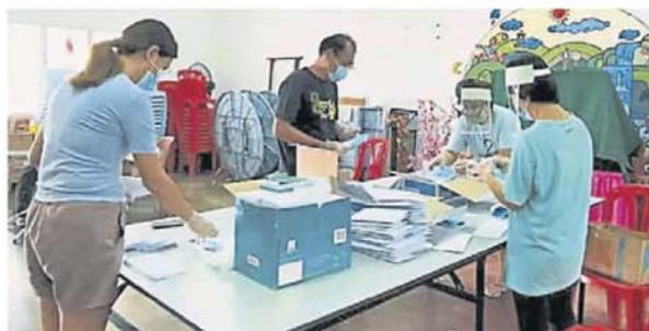
新古毛志工包装口罩时也戴上口罩和手套进行防护。

管控令期间，20 位志工在管委会会所包装口罩也须保持社交距离、穿手套和戴口罩，而且只能在上午时段工作。从前天开始包装，预料周四能把口罩分派出去，把选区分成 50 个区，每次出