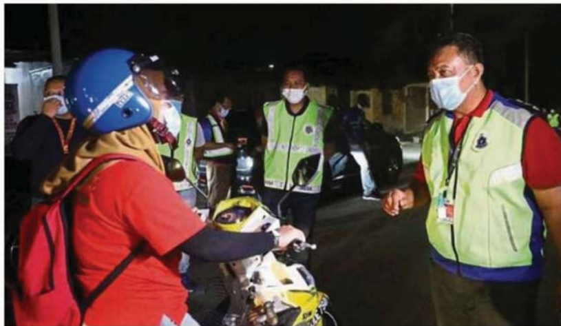
A woman motorcyclist being questioned on her reason for being on the road during the joint night operation headed by MBSA.

TWENTY-NINE people were brought to the Sungai Buloh police station for further investigation following a joint night operation led by the Shah Alam City Council (MBSA).