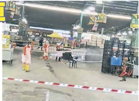
■隨著今日(15日)共有136攤蔬菜休業,也整個批發公市更為冷淡,沒有了過去人來人往的情況。