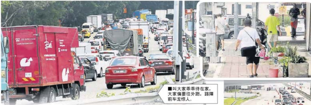
■外出购买食物，是最常见的藉口。 ■虽然警方在各主要路口设立路障，但是还是阻止不了民众企图“闯关”外出。

Provided for client's internal research purposes only. May not be further copied, distributed, sold or published in any form without the prior consent of the copyright owner.