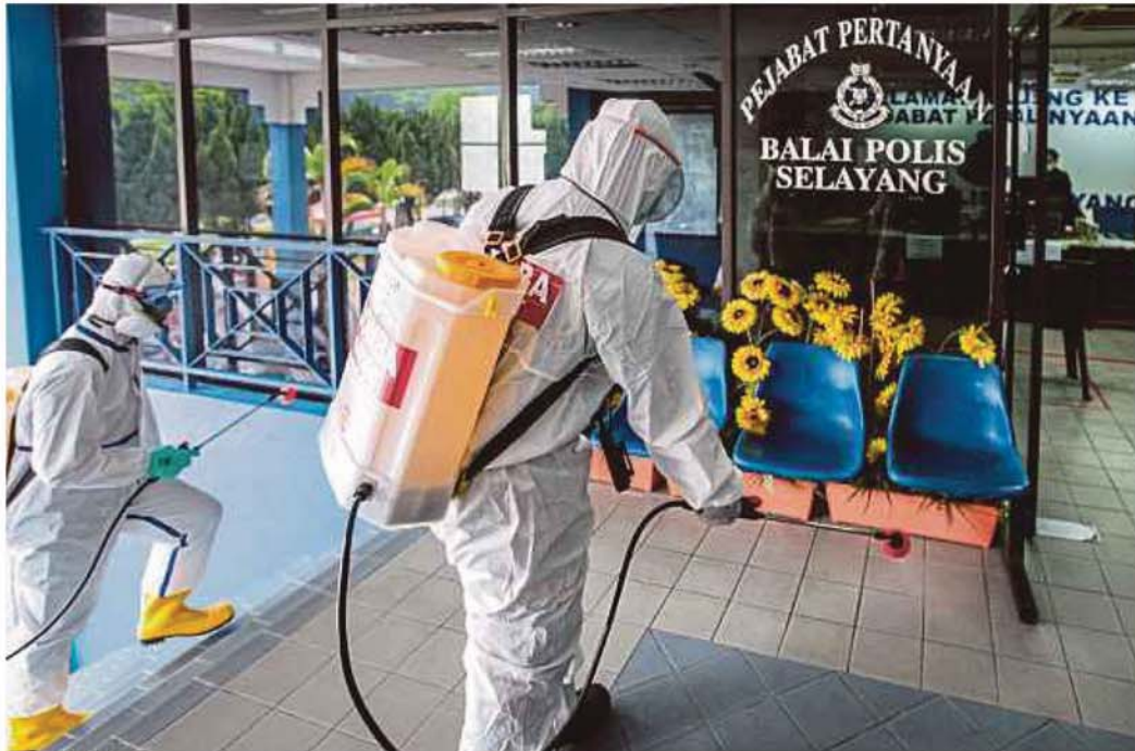
Anggota bomba bersama Jabatan Pengurusan Sisa Pepejal Dan Kesihatan Majlis Perbandaran Selayang membuat semburan nyah kuman di Balai Polis Selayang, semalam.