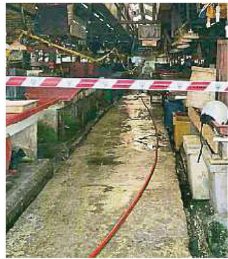
吉隆坡市政局周三早上封锁士拉央旧批发公市，以进行消毒和清洁工作。