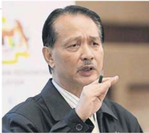
诺希山：卫生部加紧监控28个小的感染群。

(布城15日讯)自国内2019冠状病毒病确诊病例连续31天单日录得3位数病例后，今日首次降至双