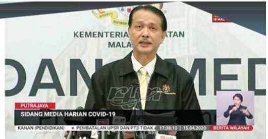
诺希山：周三只有一宗死亡病例，累计的死亡病例达 83 宗，即 1.64%。