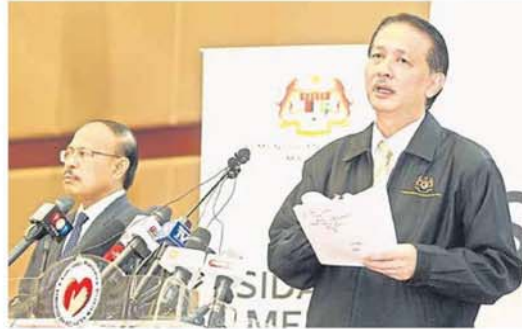
■诺希山说，新冠肺炎病例在连续31天单日录得3位数增长后，终于周三迎来仅为2位数的新增病例；左为卫生部副总监（医药）罗海礼。

(布城15日讯) 卫生总监拿督诺希山分析我国在完成2个阶段的行管令后的成果时表示，新冠肺炎疫情已经受到一定的控制，而第三阶段的行管令目的是通过针对性方法，加大力度减少病例。