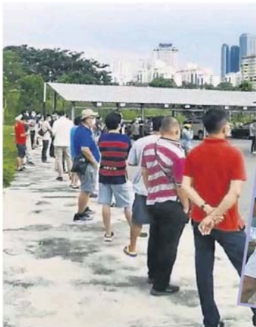
■106攤的蔬菜批發商和本地工人15日前往PANTAI ECO PARK 社區中心接受檢測,大家都在大排長龍等待檢測。