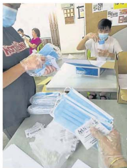
4 个口罩分装在一个信封，且附上一张印有“NADMA”字眼和资料的纸条，相当费时。

之前在烟霾袭击时刻，每盒 50 片装的口罩售价才 12 令吉，现在顶价是每片 1 令吉 50 仙，一盒 50 片装的口罩要 75 令吉，乡区居民无法负担。