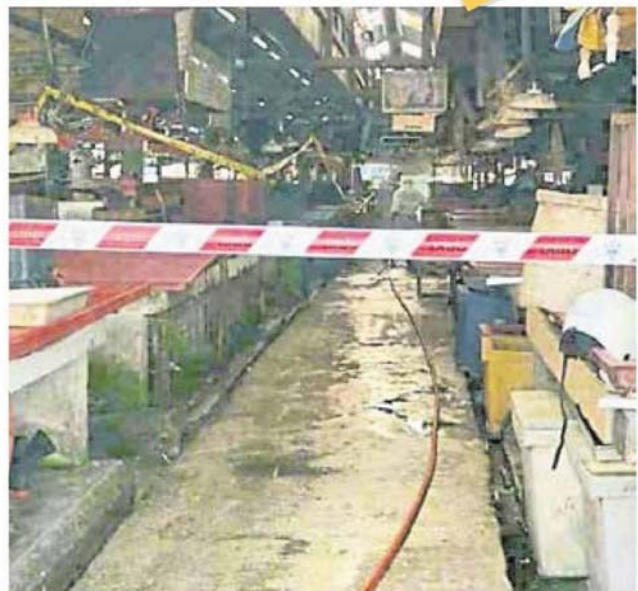
■吉隆坡市政局周三封锁士拉央旧批发公市，以进行更全面的消毒和清洁工作。

“第一批检测的所有小贩及员工皆呈阴性反应，第二批近百人的检测报告这一两天内知晓。”（TTE）