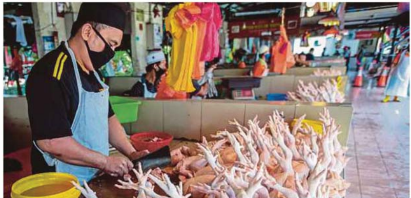
Harga ayam segar dijual pada harga biasa sebelum PKP di Pasar Tani Kekal Selayang.

Harga tomato pula RM3.99 sekilogram, manakala kubis antara RM2.29 hingga RM5.59; tepung gandum (RM1.80 hingga RM2.10 sebungkus); minyak masak (RM11.80 hingga RM28.79).