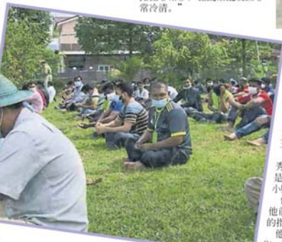
■在106攤工作的外勞也於15日在批發公市外集合,等待市政局載往峇都慕達的禮堂進行檢測。