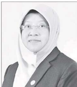
哈妮扎 ◉ 公正党妇女组主席