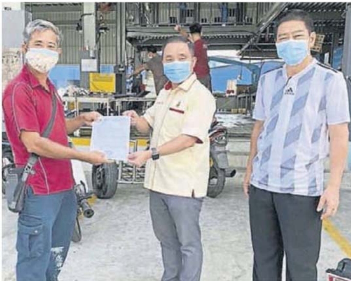
■ 南 津县 贴贴 柴油 油柴 价油 格格 的的信 函函 交交 予予 渔渔 总总 要要 求求 农农 业业 部部 调调 整整

“渔民在政府宣布的经济振兴配套，也没有明显受惠，却肩负著确保食物供应稳定的关键角色，因此为了保证我国人民享有稳定的渔获供应，希望政府聆听渔民的心声。”