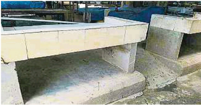
为方便彻底进行消毒，吉隆坡市政局指示小贩清除摊位底下的杂物。