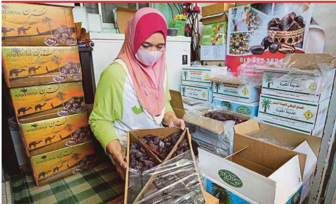
A woman packing dates to sell on the Ramadan e-bazaar at her premises in Senawang, Negri Sembilan, recently. The government has issued a Standard Operating Procedure for Ramadan bazaars to be adopted by all states.