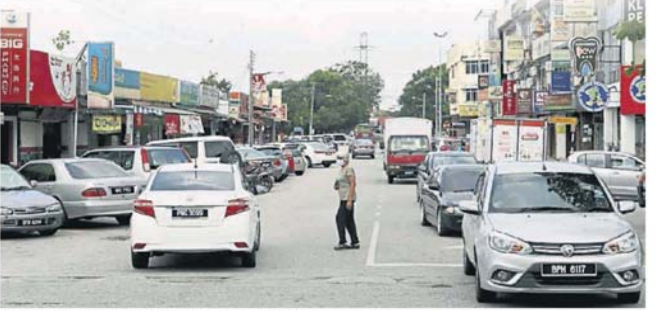
■商业区泊满车，大家还是一如往昔，外出消费。